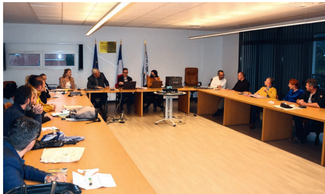
Dépouillement « électronique » dans les locaux du Centre de Gestion du Var le 8 décembre dernier à l'occasion des élections professionnelles.

Du 1 er au 8 décembre dernier, l'ensemble des agents des collectivités et établissements publics du Var étaient invités à choisir leurs représentants pour les différentes instances de dialogue social (Commissions Administratives Paritaires, Commissions Consultatives Paritaires et Comité Social Territorial). Pour la 1 ère fois, il a été choisi de recourir au vote électronique par Internet comme modalité exclusive d'expression des suffrages.