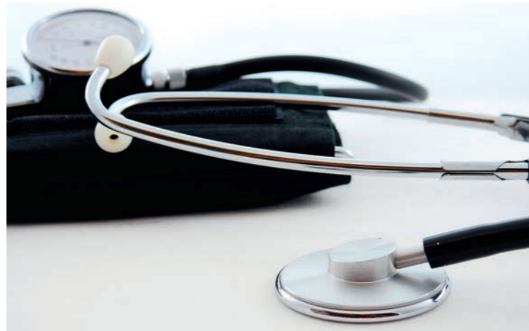
Le Conseil médical regroupe désormais le Comité médical et la Commission de réforme. Une nouvelle instance qui prévoit beaucoup de nouveautés.