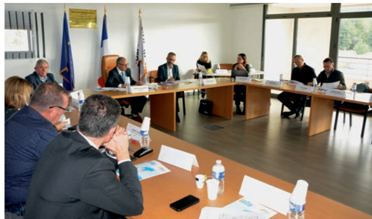
Durant son conseil d'administration du 10 novembre 2022, le Centre de Gestion a fait le choix de conserver la baisse de son taux de cotisation additionnelle à 0,40% (au lieu de 0,60%) et ce malgré la hausse des coûts de l'énergie et du point d'indice.