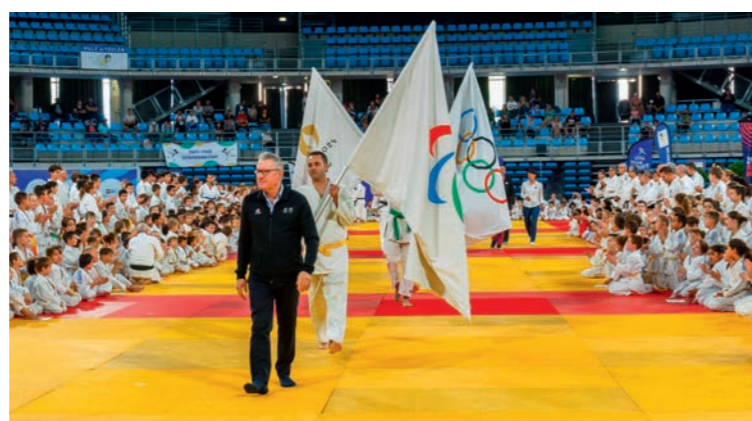
Thierry Rey et la délégation du Comité Olympique au palais des sports de Toulon, dans le cadre de la tournée des drapeaux olympiques et paralympiques